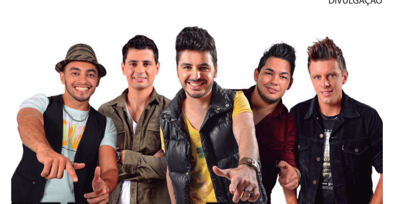
Banda Westboys fará a animação do evento

Os ingressos já estão à venda na sede da Associação Setembro e no Posto Santana Shell pelo valor de R$ 80,00 e com este evento, a Associação pretende angariar fundos para as entidades que apoia, como o Hospital de Caridade, APAE, Mão Amiga, Amigos da Cultura, ACADES, Casa de Passagem, Sociedade Humanitária, Casa Dom Bosco e Grupo Pais que Amam.